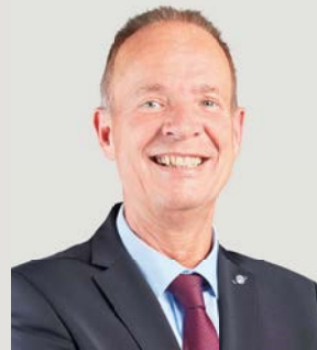
Theo Melcher Landratskandidat

Als Landrat möchte ich mit den Mitgliedern des Kreistages, sowie den Bürgermeistern und den Gemeinde- und Stadträten die Chancen der Digitalisierung nutzen und unseren Kreis nachhaltig und authentisch für die Zukunft fit machen. Eine starke Stadt Attendorn – ein starker Kreis Olpe!