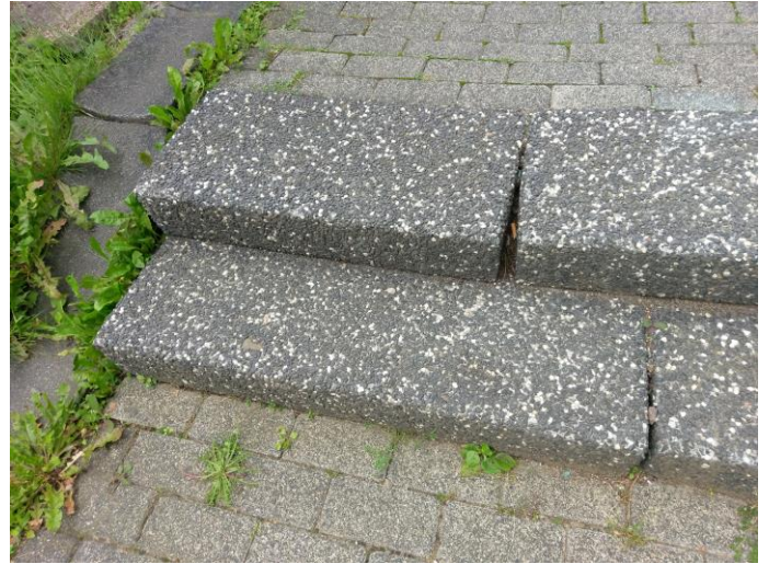
Der Schul- und Fußweg zwischen der Mindener und Dortmunder Straße