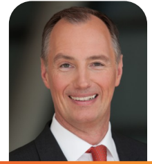
Dr. Matthias Heider MdB

Bundestagsabgeordneter Kreis Olpe/Märkischer Kreis I